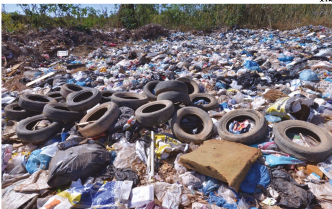
Goiás enfrenta a situação crítica de 186 lixões ativos, principal destino inadequado de resíduos sólidos