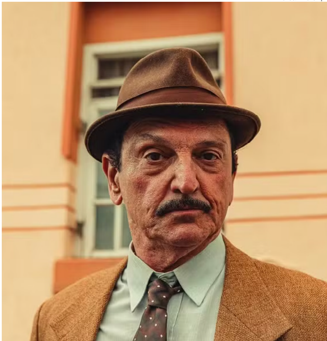
Dedicado no ofício: ex-titã afirma que personagem veio com muito estudo

"Esse Adoniran veio com muito estudo, não é o mesmo que eu conheci na adolescência. Eu sempre amei o samba dele, e a minha formação de músico vem da música popular brasileira. Então fiquei muito feliz de resgatar essa figura emblemática", diz o ator e ex-Titãs, que recebeu durante