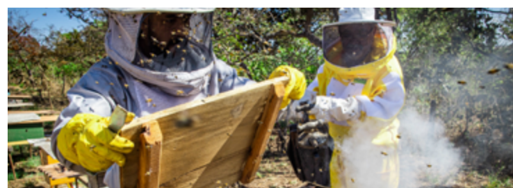
Organização revela que atividade é gratuita e conta com palestras que trazem informações sobre o mercado e outros temas

A programação prevê para as 10h abertura Oficial, falas institucionais e lançamento da realidade virtual em apicultura; 10h40 - Palestra: AgroBr: Exportação de Mel; 11h - Mesa Redonda com Seapa e Agrodefesa sobre regulamentação da apicultura / e palestras 'Panorama