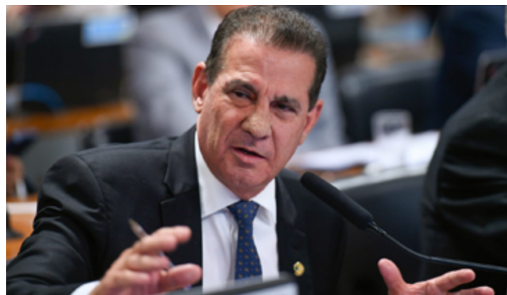
Vanderlan Cardoso: governo precisa cortar gastos