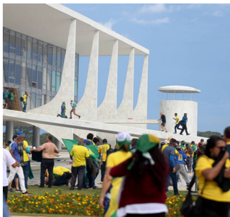
Justiça pode absolver dois acusados de atos golpistas